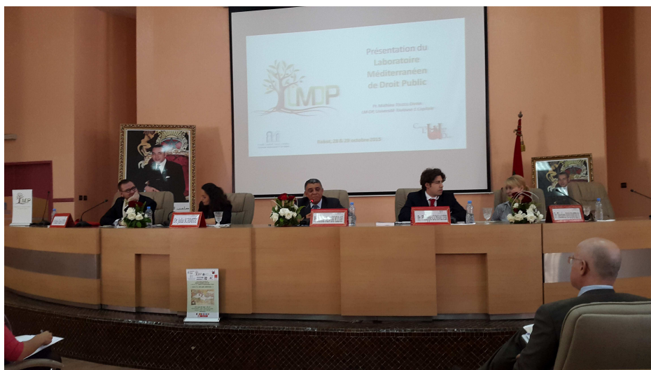
ILLUSTRATION des colloques