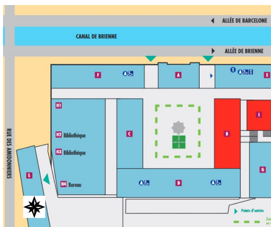
Sites de la Manufacture (entrée rue des amidonniers)

Dès 14h30 - site des anciennes Facultés (amphi. COUZINET)